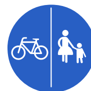
Verkehrszeichen 241 „Getrennter Rad- und Gehweg, Radweg links“

+++ Lohnt sich ein Einspruch gegen den Bußgeldbescheid? Prüfen Sie jetzt Ihre Möglichkeiten auf www.sos-verkehrsrecht.de ! +++