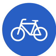
Verkehrszeichen 237 „Radweg“

Wenn der Gehweg durch das Verkehrszeichen 240 für Radfahrer freigegeben ist, darf auch dieser mit Fahrrädern befahren werden. Ansonsten dürfen nur Kinder bis zum vollendetem 10. Lebensjahr den Gehweg mit dem Rad befahren.